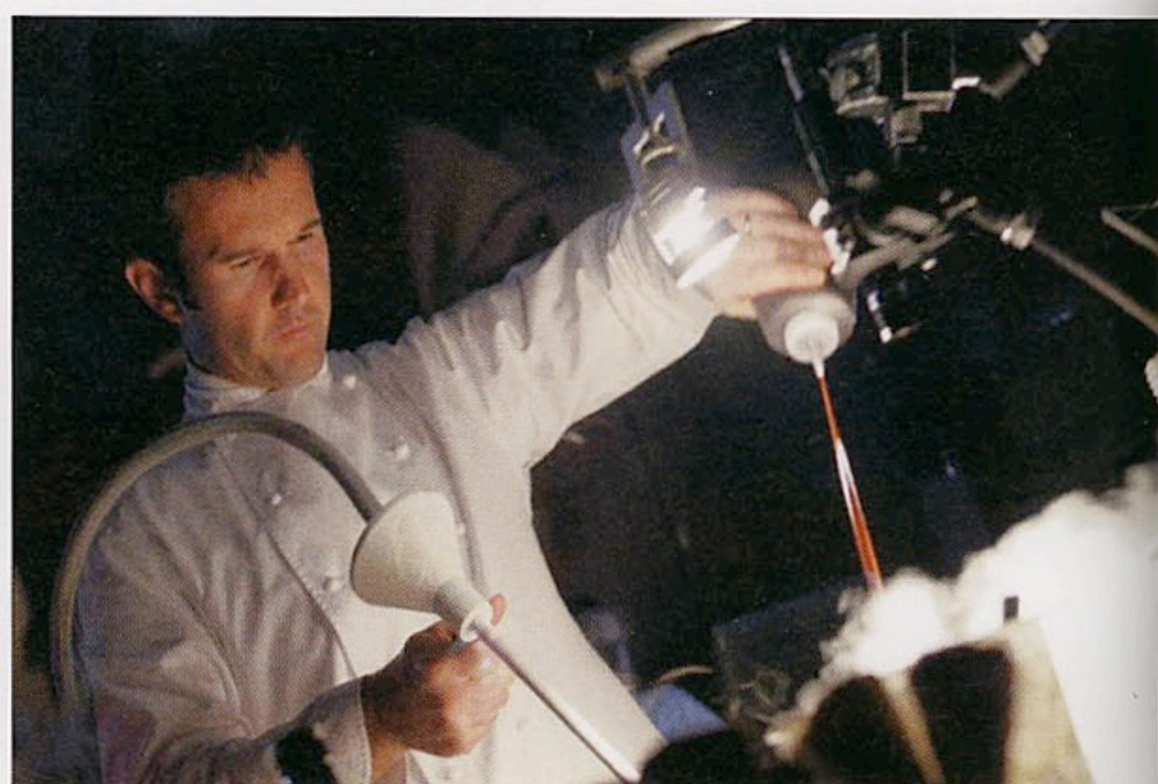
Carlo Cracco: a Milano, grazie all'azoto liquido, ha trasformato succhi di frutta in gelato.