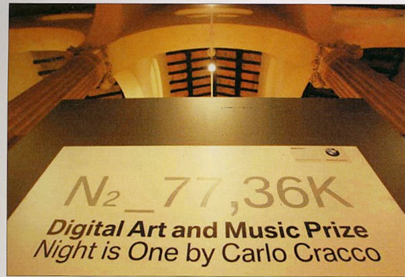
L'ingresso del party di Milano alla Rotonda della Besana, ideato da Carlo Cracco.