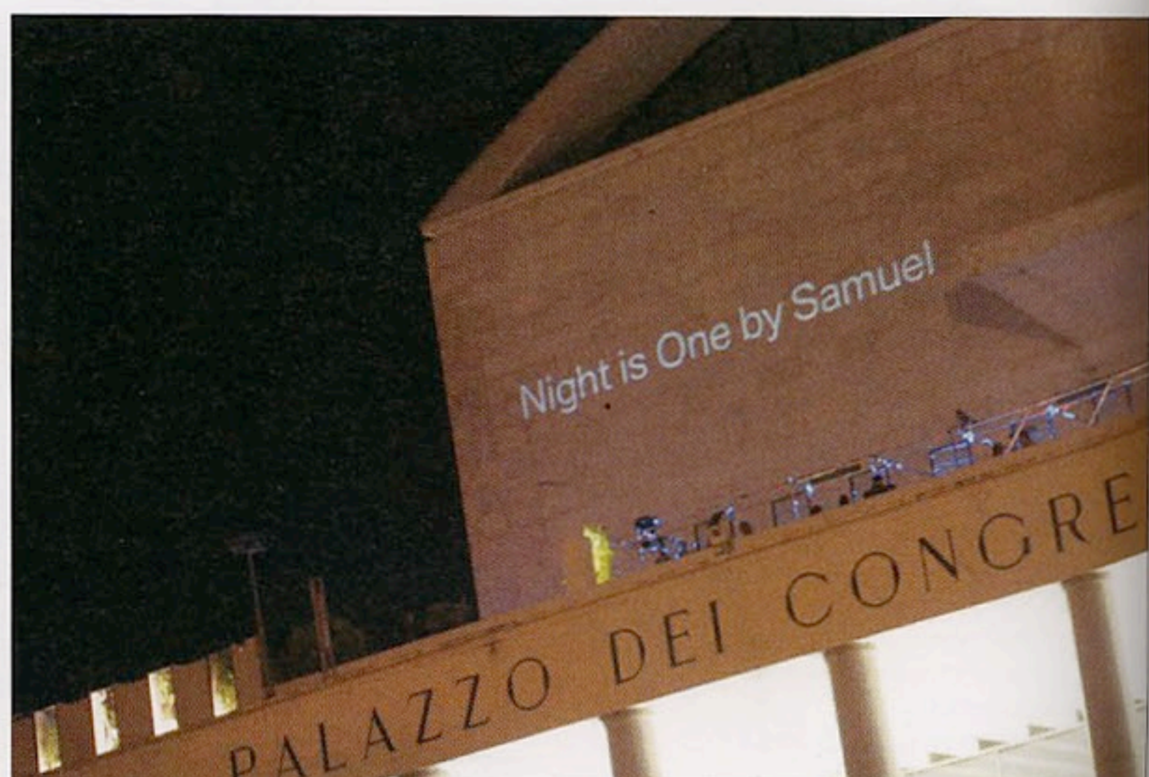
Una vista notturna del Palazzo dei Congressi di Roma dove a luglio si è tenuto il party.