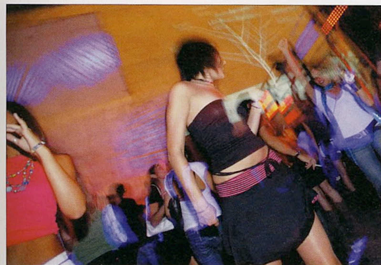
Un altro momento del party romano sulla terrazza del Palazzo dei Congressi all'Eur.