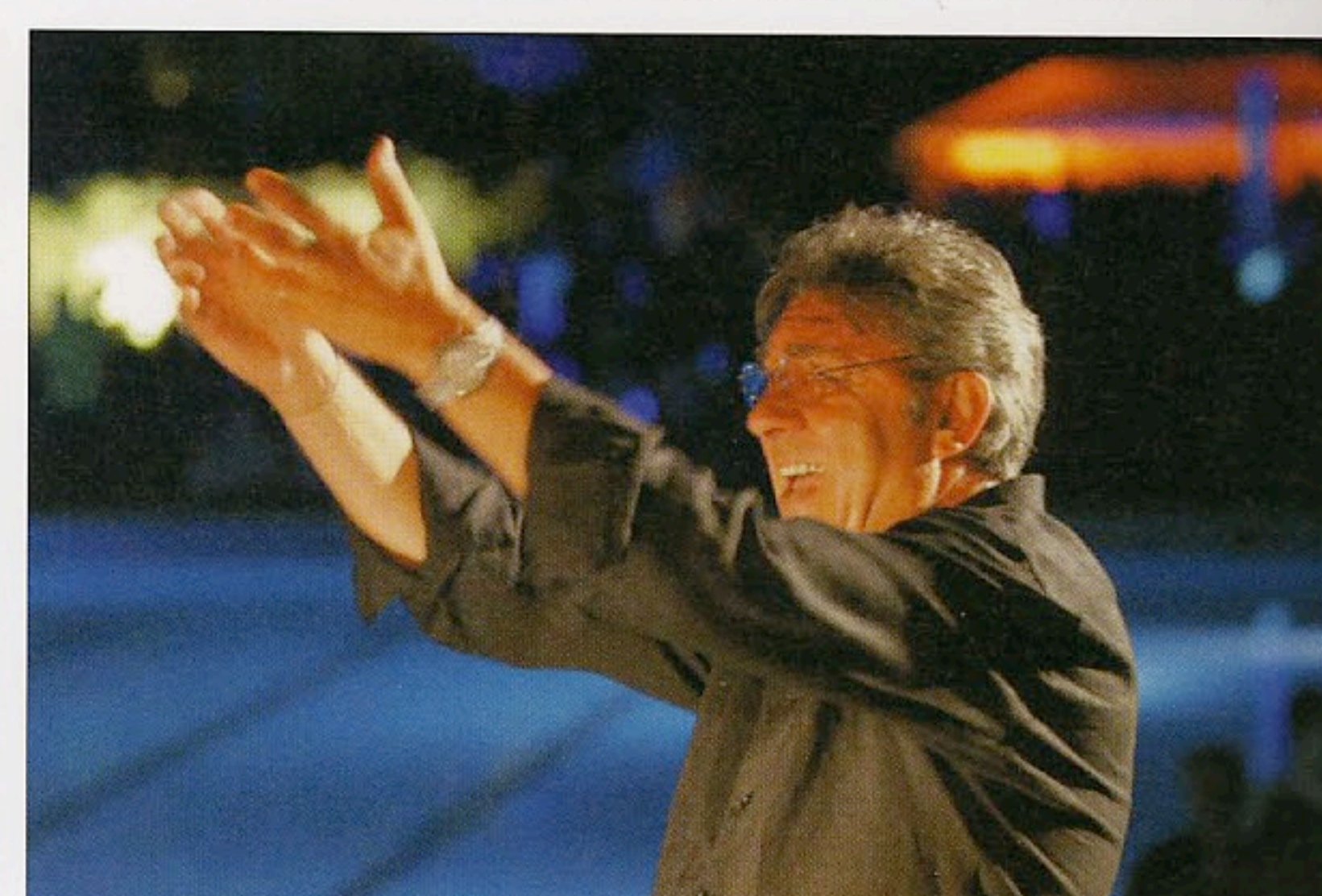
Il Maestro Franco Micalizzi (e la sua big band) hanno suonato per il party di Firenze.

autore di colonne sonore di film pulp anni 70 oggi trasformatesi in hit easy-listening. L'atmosfera è stata poi rivoluzionata dall'arrivo degli Addictive Tv, combo inglese che ha proposto in stile mash-up una raffica di remix di pellicole d'epoca tra omaggi a James Bond e remake del film cult The Italian Job . Roma, a inizio luglio, ha invece ospitato la Night is One by Samuel sulla terrazza del Palazzo dei Congressi all'Eur. Il front man dei Subsonica si è presentato dietro la consolle nei panni di dj, in compagnia di Pisti. La "sua" notte, che ha aperto la stagione del Beat Park (festival di musica elettronica dell'estate romana), si è distinta per l'avveniristico progetto d'allestimento tecnico e scenografico: un'imponente struttura d'acciaio che sosteneva una ragnatela di schermi led con i quali il pubblico ha potuto interferire, creando uno spazio sempre nuovo