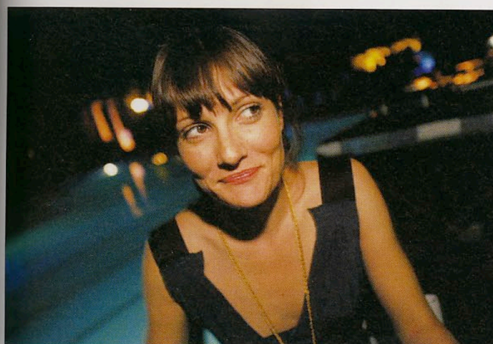
Victoria ha creato a Villa Le Pavoniere di Firenze un tranquillo party a bordo piscina.

TESTO GIOVANNI ROMANO