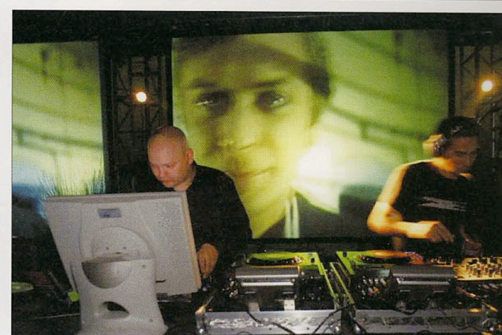
A Firenze gli inglesi Addictive Tv hanno proposto una raffica di remix di film d'epoca.

Cinque appuntamenti, cinque diverse città italiane. E altrettanti personaggi del mondo della creatività nel ruolo di curatori e direttori artistici di ciascun evento: lo chef Carlo Cracco, l'anchorwoman Victoria Cabello, Samuel dei Subsonica, il dj Claudio Coccoluto e l'attrice Stefania Rocca. Con questo originale progetto Bmw Serie I ha lanciato Night is One. Digital Art and Music Prize , una sfida ad artisti tra loro distanti per esperienze e know-how, affidandogli il compito di progettare il "party perfetto" per originalità, innovazione, stile. Ogni appuntamento si svolge durante un evento di grosso impatto mediatico e culturale: il Salone del Mobile di Milano, il Pitti Immagine di Firenze, il Beat Park di Roma, la Notte Bianca di Napoli ed il binomio Artissima e Club2Club di Torino.